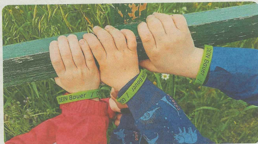
Auch Bildungsarbeit in Kitas, Schulen und im Erwachsenenbereich gehört zum vielfältigen Wirken des Verbands.

beratungsabteilung aufgebaut. 1988 wurde die eigenständige LSM Steuerberatungsgesellschaft mbH gegründet. Die steuerliche Beratung von landwirtschaftlichen, gewerblichen und privaten Mandanten, die