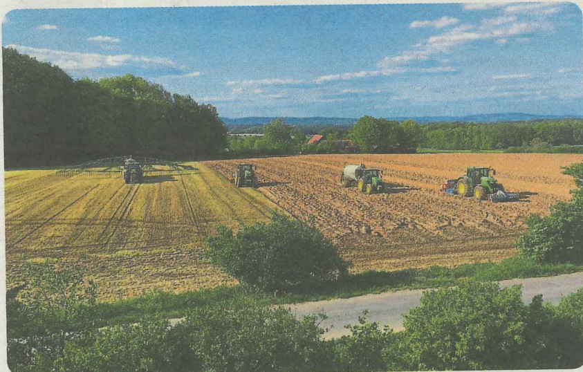
Der Kreislandvolkverband Melle e.V. macht sich für eine moderne Landwirtschaft stark.

Kreislandvolkverband Melle e.V. Gesmolder Straße 7 49324 Melle Telefon: 05422 95020 Fax: 05422 950230 info@landvolk-melle.de www.landvolk-melle.de Öffnungszeiten Geschäftsstelle: mo. bis do. 8.00 bis 16.30 Uhr freitags 8.00 bis 13.00 Uhr